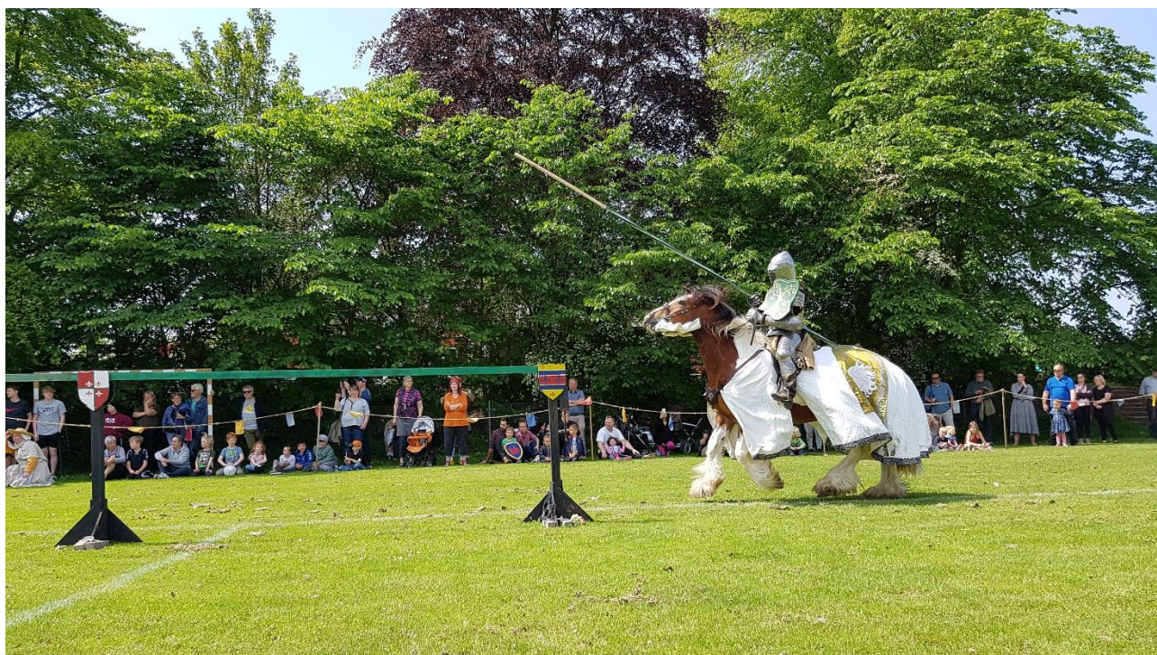
Middelaldermarked på Blicheregnen, et nyt initiativ.