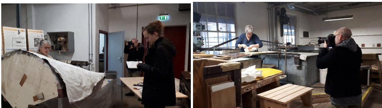
Kunstnere fra Faktor 13 er i færd med at lave kunst i papir til udstillingen Papir til kanten. Midtjyllands avis bevidner processen.

Året igennem har Papirmuseet haft besøg af kunstnere fra kunstnergruppen Faktor 13, der har været i gang med at skabe værker til den kommende sommerudstilling på Hovedgården, Papir til Kanten. Kunstnergruppen har på Papirmuseet hentet inspiration, konkret hjælp og materialer til arbejdet. Endelig blev traditionen med at afholde en kunsthåndværkerdag videreført i Papirmuseets regi - med stor succes. Det bliver derfor også næste år Papirmuseet, der huser dette marked.