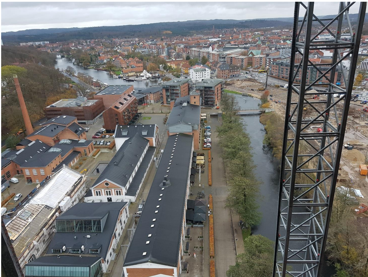
2019 var også året hvor Papirmuseet fik en ny, meget høj nabo. Udsigt over papirfabrikken set mod syd.

Året igennem har Papirmuseet haft besøg af kunstnere fra kunstnergruppen Faktor 13, der har været i gang med at skabe værker til den kommende sommerudstilling på Hovedgården, Papir til Kanten. Kunstnergruppen har på Papirmuseet hentet inspiration, konkret hjælp og materialer til arbejdet. Endelig blev traditionen med at afholde en kunsthåndværkerdag videreført i Papirmuseets regi - med stor succes. Det bliver derfor også næste år Papirmuseet, der huser dette marked.