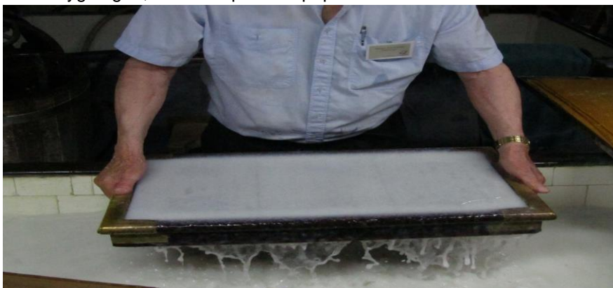
Det var i forme af denne størrelse, papiret til den gamle 500 kr. seddel, den såkaldte plovmand, blev lavet.