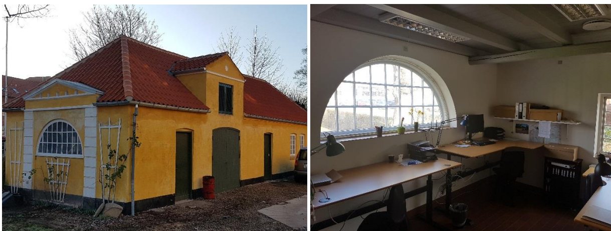
"Tv. Badehotellet med sit fine nye tegltag. Th. arkæologernes kontor mod nord.

Her i slutningen af februar 2020 er renoveringen endelig tilendebragt, og det indre er ligeledes færdigindrettet. De tre arkæologer og konservatoren, der har sæde i bygningen, har fået virkelig dejlige rammer, og jeg gætter på, at ingen kommer til at savne det gamle u-isolerede loft.