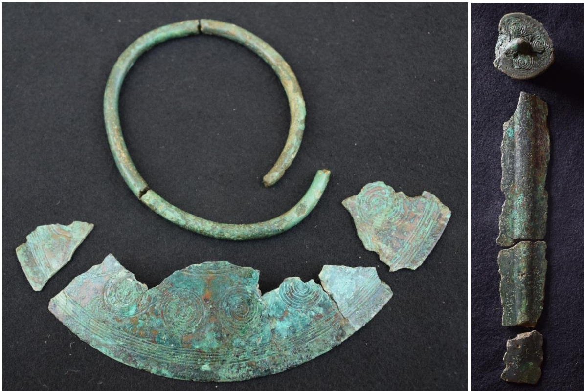
Ovennævnte bælteplade, armbånd og sværd fra Sminge.

med stor sandsynlighed tale om opløjede grave fra en nu næsten forsvundet gravhøj. Bæltepladen er en typisk kvindegravgave, mens sværdet er en typisk mandsgravgave. Armbånd kan bæres af både mænd og kvinder, og kan ikke med sikkerhed knyttes til en mands- eller kvindegrav. De tre genstande må derfor stamme fra mindst to grave, muligvis tre. Museet har sendt en ansøgning til Slots- og Kulturstyrelsen om midler til en sonderende undersøgelse af fundstedet, så forhåbentlig bliver der mulighed for at blive klogere på, hvorfra de fine genstande stammer.