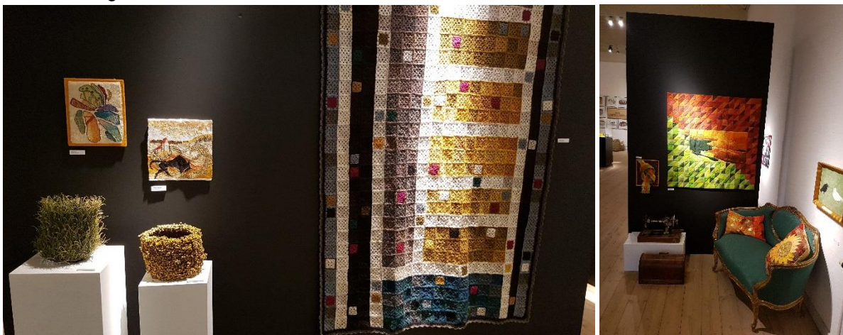
Et par indtryk af nogle af de mere farverige dele af Kontrast.