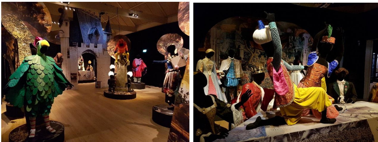
Et blik ind i Eventyrdronningens legende univers. Th. den magiske skov og tv. fest på slottet.