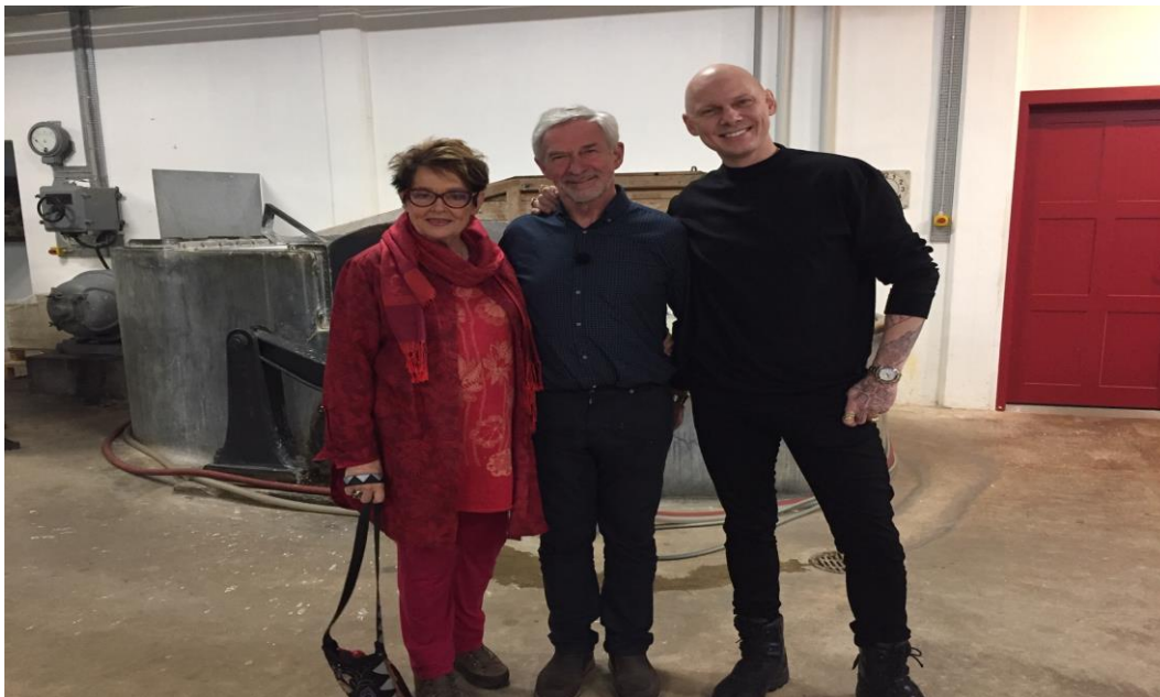
Jim og Ghita besøgte papirmuseet, og det gav en del opmærksomhed.

mennesker, Ghita Nørby og Jim Lyngvild. Udsendelsen blev sendt i den bedste sendetid den 20. maj på Danmarks Radio og var en god og fornem eksponering af Papirmuseet.