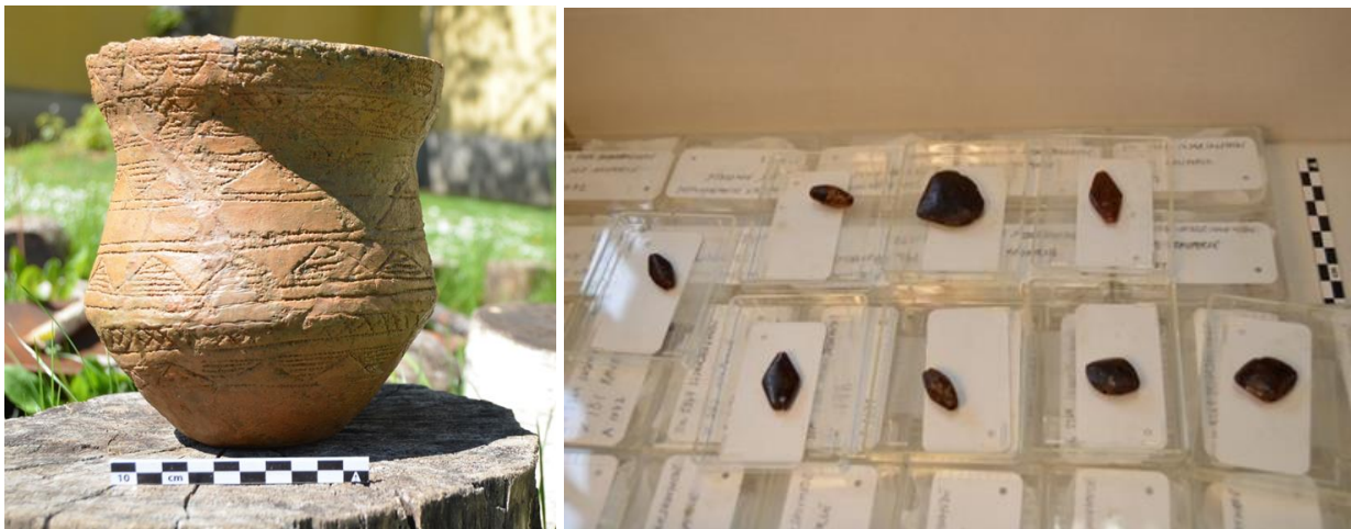
Klokkebægeret og nogle få af de 62 ravperler, efter de havde været over konservatorens bord.

har givetvis været samlet som en kæde, men nogen af perlerne viser slid, som har de været syet på et klæde eller lignende.