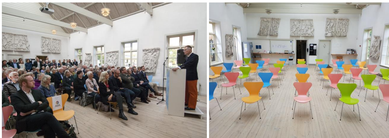
De to fotos illustrerer forskellen mellem 2020 og 2019. Tv. et billede af åbningen af udstillingen Eventyrdronningen. Th. er caféen klargjort til åbningen af Papir til kanten i juni 2020.

Året 2020 på Museum Silkeborg blev unægtelig noget anderledes, end vi havde planlagt det. Så er det sagt. Covid-19, og regeringens bestræbelser på at tackle situationen, overtog på mange måder styringen af året. På ganske mange områder kunne Museum Silkeborg egentlig fortsætte næsten som i et normalt år. Det gjaldt bl.a. den arkæologiske virksomhed, der året igennem har haft ganske travlt. Men mange af de udadvendte aktiviteter, udstillingerne, arrangementerne og foredragene blev ramt. Den 12. marts lukkede museet, som resten af Danmark, for publikum og publikumsarrangementer. Da museet kunne åbne igen den næstsidste dag i maj - ekstra rengjort, med spritdispensere og vejviserpile på gulvet - var det til en anden virkelighed. Den populære udstilling "Eventyrdronningen", der havde været perfekt timet i forhold til Dronningens 80-års fødselsdag og påske, var taget ned. Kustoderne, der i to en halv måned ikke kunne servicere museets gæster, havde i mellemtiden løst en lang række andre opgaver, lige fra rengøring i de permanente udstillinger og nedtagning af "Eventyrdronningen" til nummerering af arkæologiske fund.