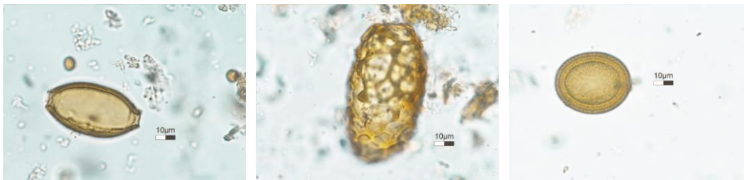
Tollundmanden var ikke den eneste der havde gavn af det sidste måltid. De nye undersøgelser af maveindholdet viser at også (fra venstre mod højre) piskeorm, spolorm og bændelorm deltog i måltidet.

de store resultater, men nye analyseinstrumenter gav mulighed for at foretage endnu bedre analyser denne gang. Resultaterne af undersøgelserne var så detaljerede, at de gav mulighed for – med lidt god vilje – at opstille en opskrift for Tollundmandens sidste måltid. Vi er derfor nu blevet meget klogere på Tollundmandens sidste måltid, som vi kender mere detaljeret og som også afslørede et par hemmeligheder – nemlig, at han formentlig også har spist fed fisk som en del af måltidet. Udover at give indsigt i Tollundmandens sidste måltid gav forskningsprojektet indblik i Tollundmandens helbredstilstand. Fund af parasitæg afslører, at Tollundmanden både havde bændelorm, spolorm og piskeorm.