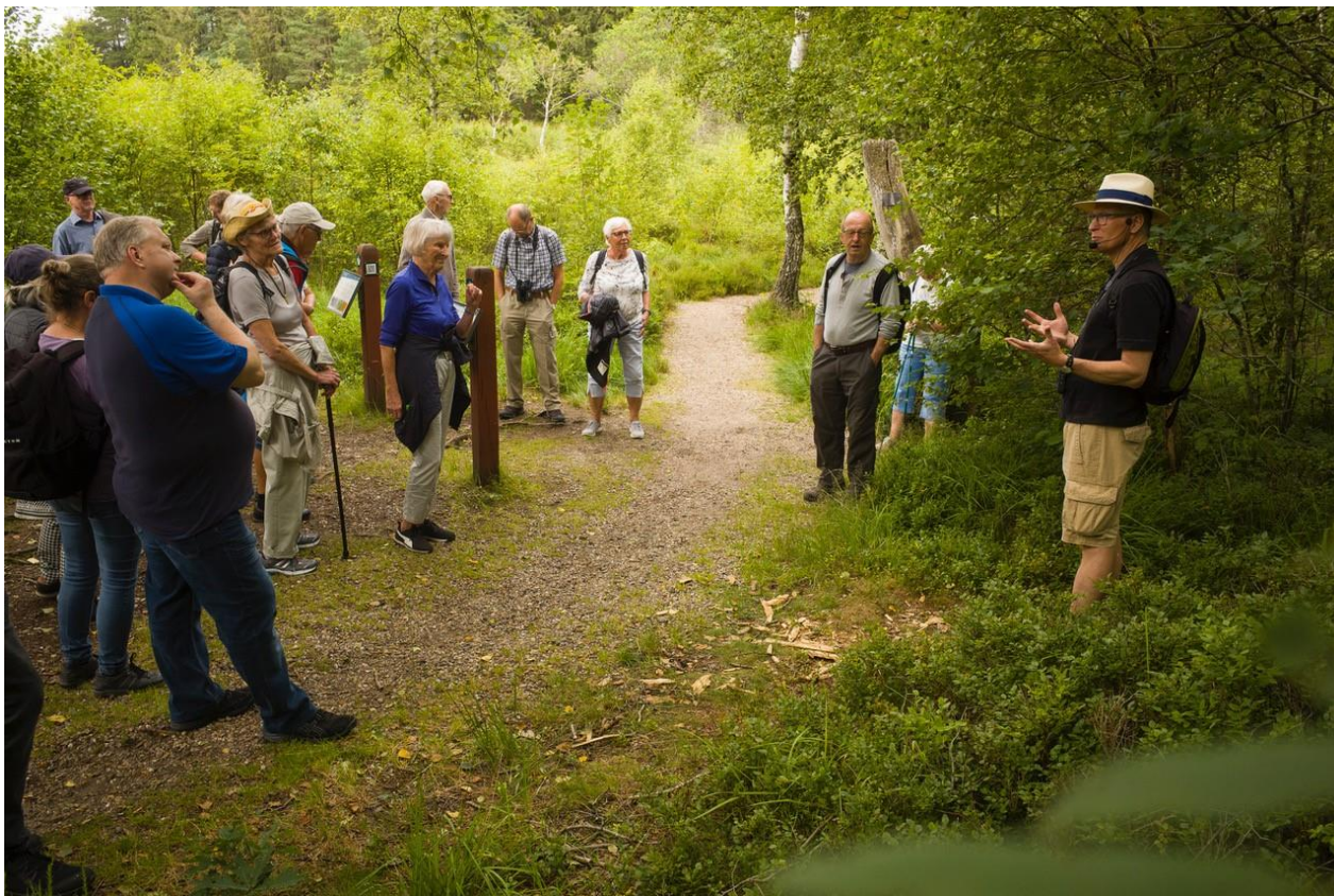
Museets kulturhistoriske vandringer var en stor succes. Her i Bjældskovdal, Tollundmandens fundsted.