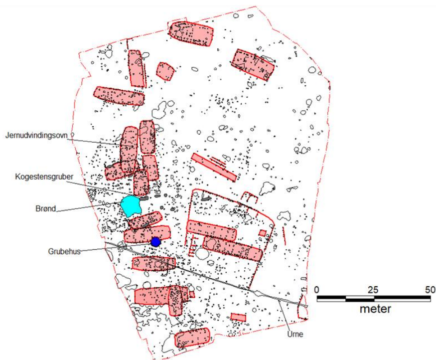
Der var bebyggelse fra yngre jernalder til tidlig middelalder, på stedet for den nye Hvinningdal Kirke.

Udover huse og hegn har udgravningen også afdækket en jernudvindingsovn, en brønd, et grubehus samt et par urnegrave fra bronzealderen. Urnerne har sandsynligvis oprindeligt været sat i kanten af en af de nu sløjfede gravhøje, der er registreret i området.