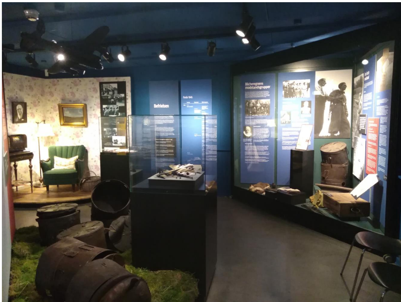
Hilsen til Tune handlede om modstandskampen på Kjellerupegnen.

Fra sidst i juni kunne man i Hovedgårdens foyer se et udvalg af de fineste fund, gjort med metaldetektor igennem det seneste år.