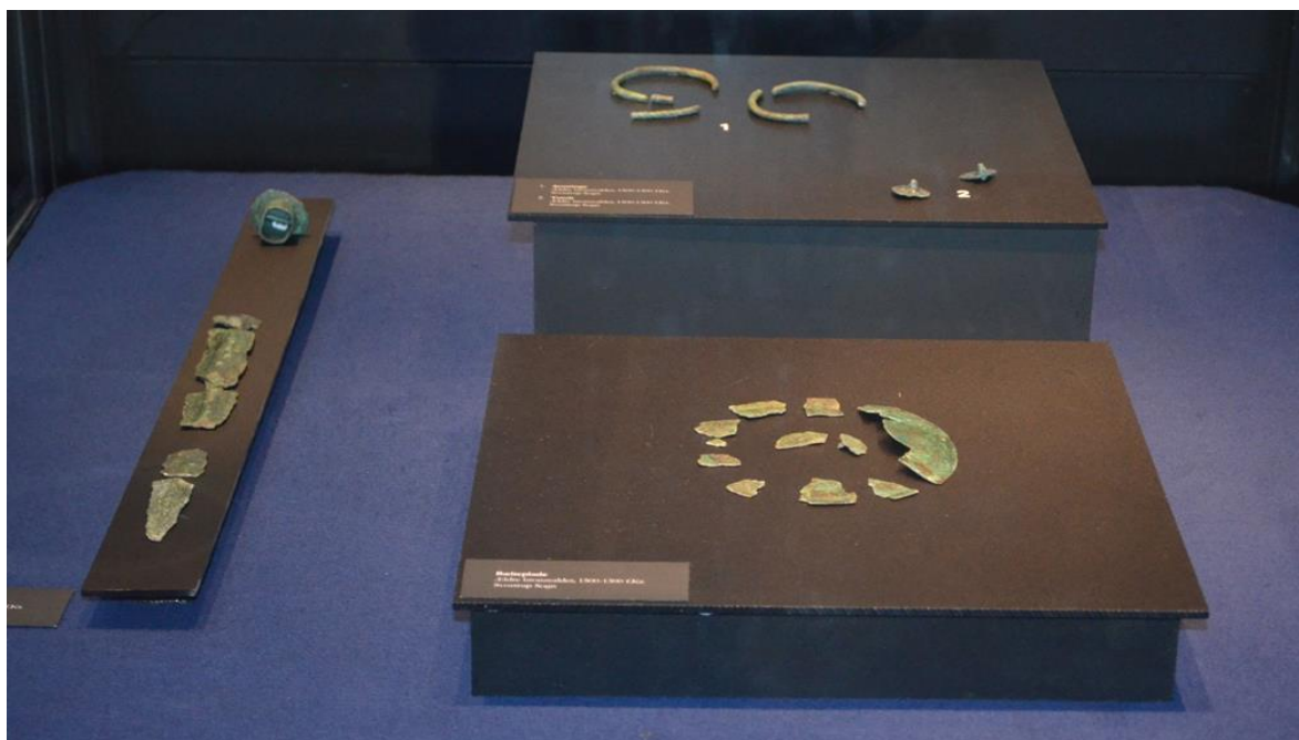
Bronzernerne fra den helt ødelagte høj i Sminge afslører, at der både har været en mand og en kvinde begravet.

Som sædvanlig har detektorfundene været en væsentlig del af det arkæologiske arbejde i år. I løbet af året har der på Hovedgården været en mindre udstilling med nogle af de bedste fund fra 2019.