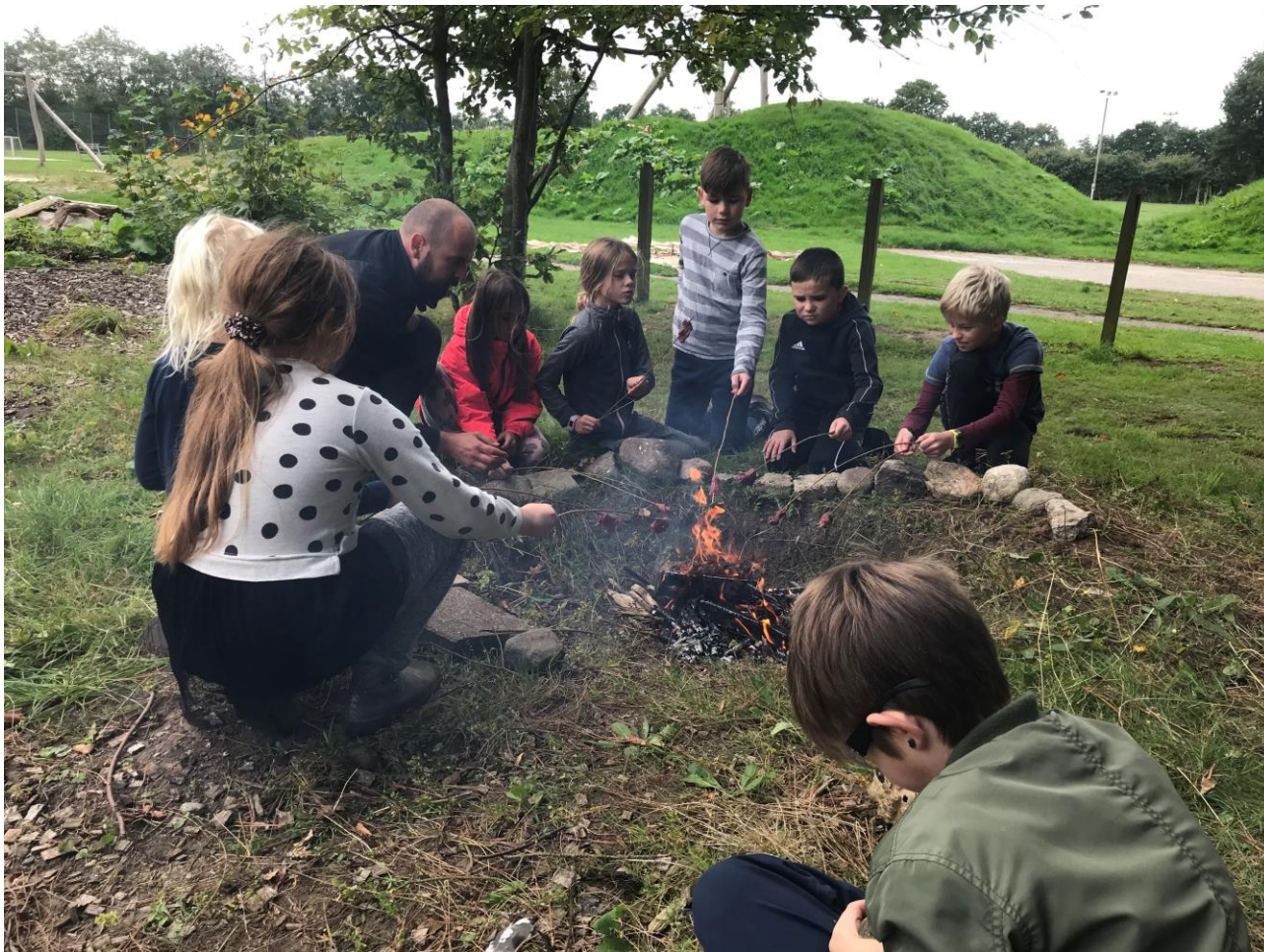
Takket være Silkeborg Kommunes Kulturboostpulje kunne børn komme i stenalderen.