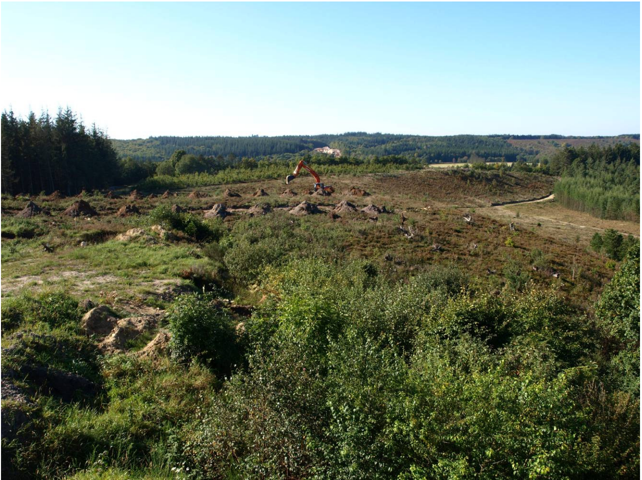
Fig. 1. Det undersøgte område set fra sydøst.

SIM 35/2008, Motorvejen/Pankas, Tollund matr. 4f og 4i, Funder sogn, Hids Herred, Viborg Amt. Stednr. 13.03.03 - 203. KUAS j.nr: 2008-7.24.02/SIM-0013.