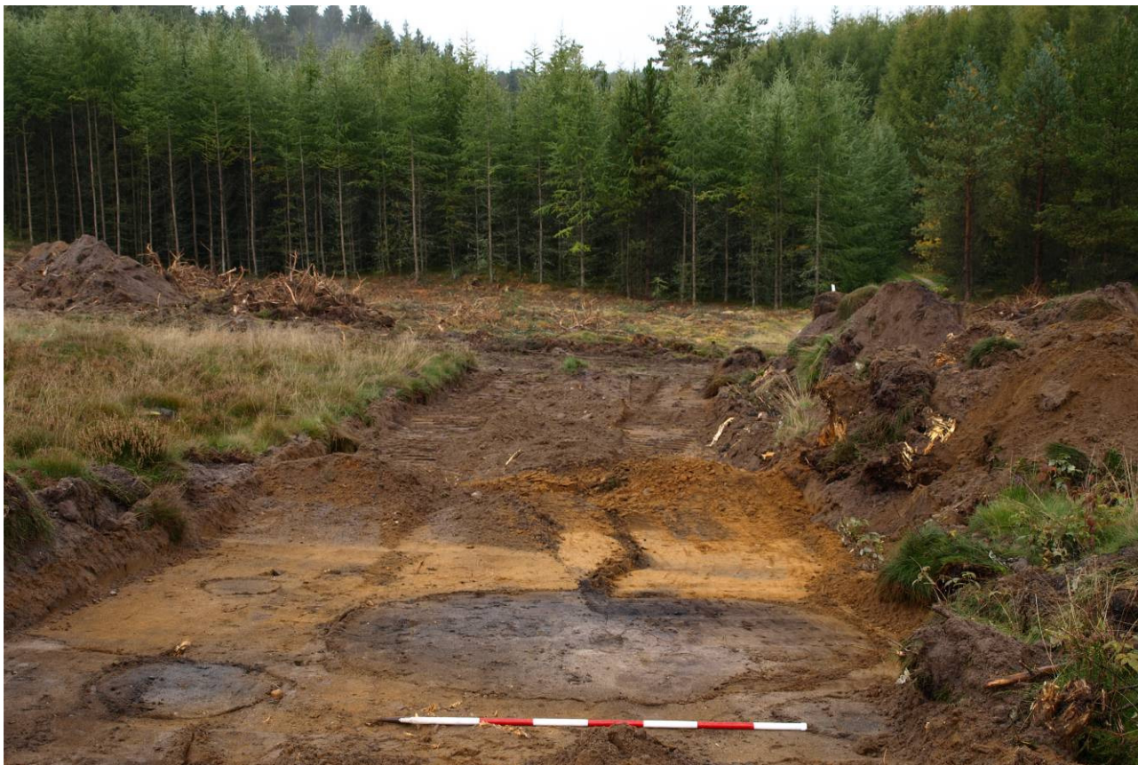
Fig. 3. Grube/trækulsmile A22 i fladen.

Spredt over størstedelen af området fremkom i alt 36 fyldskifter. Der var primært tale om mindre trækulsholdige fyldskifter, men der fremkom også fire større trækulsfyldte anlæg. De fire anlæg var tilnærmelsesvist runde og havde diameter på 2-3 m. De var mellem 15 og 45 cm dybe. Der fremkom intet i forbindelse med undersøgelsen, der kunne afklare funktionen eller dateringen af de fire anlæg, men de skal muligvis tolkes som rester efter nyere tids trækulsmiler.